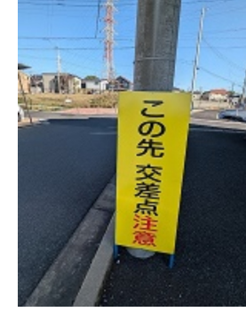
交差点の安全対策 (市野谷)4ヶ所に設置

ギャンブル等依存症セミナーに参加してきま した。流山市の取組みと、相談にのった体験 者の夫婦の事例報告がありました。(左端)