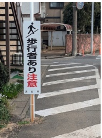
表示板の設置 (東部中通学路) 一般質問で 取り上げました