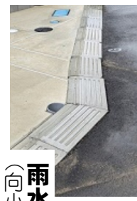
雨水蓋の修繕 (向小金1丁目)