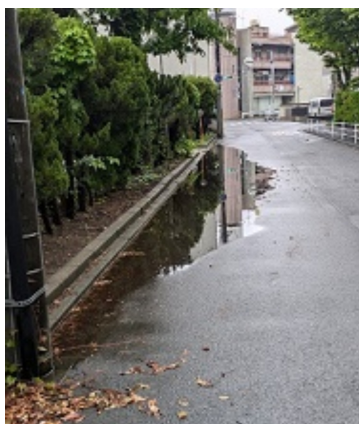
雨水の排水対策 (向小金1丁目)