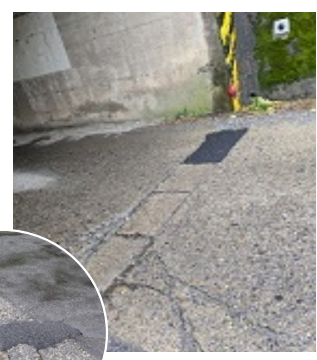
道路の補修 (前ヶ崎)