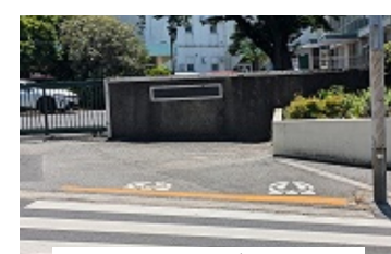
黄色線が鮮明 (長崎小学校前)