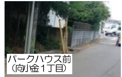
パークハウス前 (向小金1丁目)