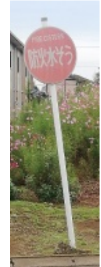
危ない標識撤去 (名都借)