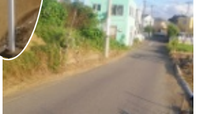
松の実保育園通り