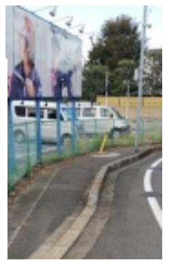
釣ヶ島前 (松ヶ丘2丁目)