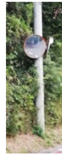
隠れたミラー (前ヶ崎)