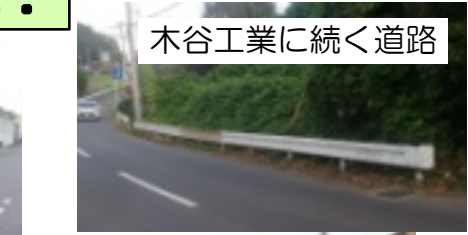
木谷工業に続く道路