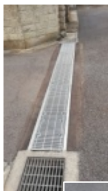
自治会と一緒に 向小金1丁目 239