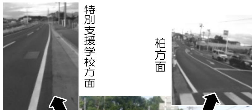
特別支援学校方面