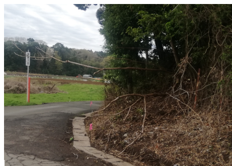
倒木の伐採 (あざみ苑裏)