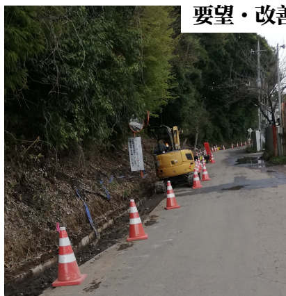
道路の舗装工事 (八木幼稚園前)