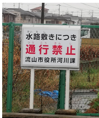
新しくなった掲示板 (野々下3-772-32)