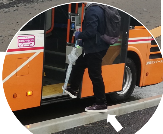
縁石を踏み越えて乗車