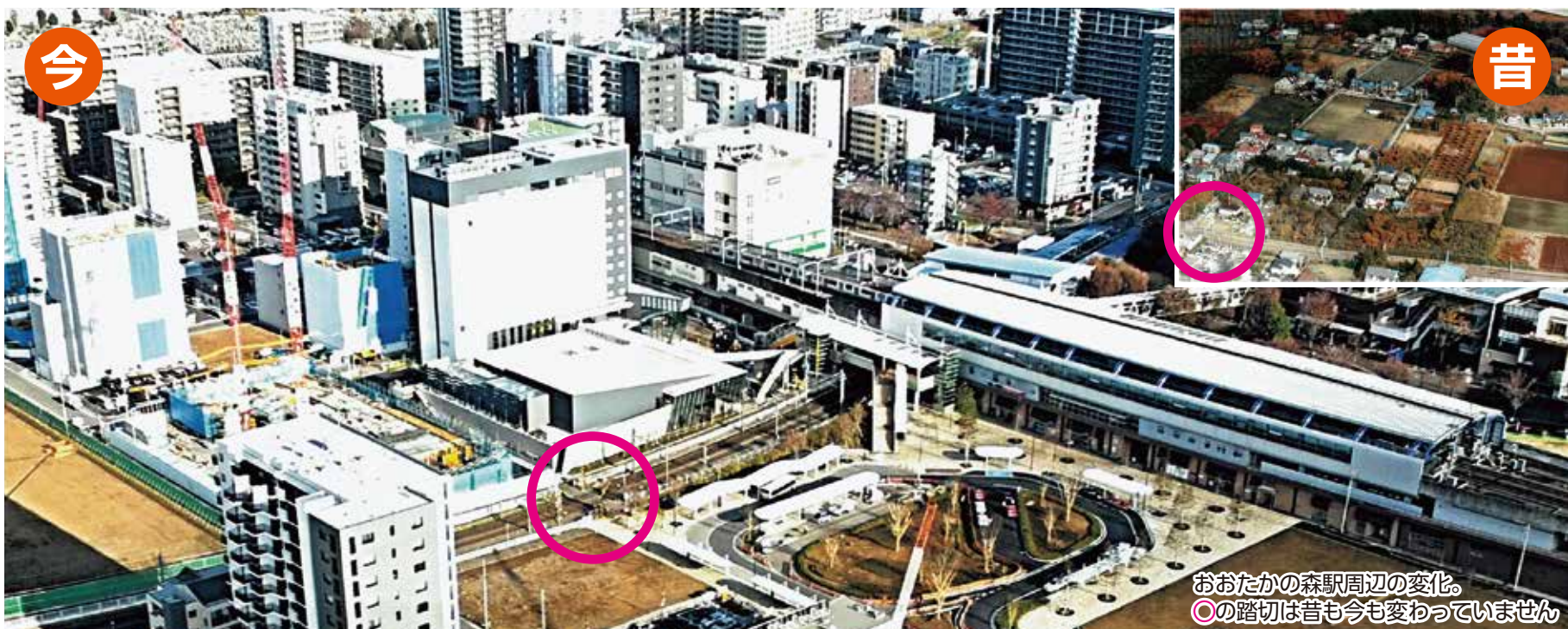
おおたかの森駅周辺の変化。 ○の踏切は昔も今も変わっていません