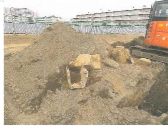
※1 コンクリート二次製品