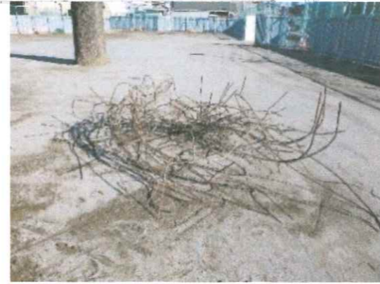
※2 鉄筋及びコンクリート二次製品