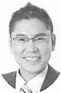
日本共産党 流山市議会議員