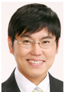
日本共産党市議会議員