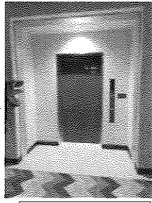
エレベーターの北部公民館 エレベーターの北部公民館 エレベーターの北部公民館

☆小・中学校の個室トイレに生理用品設置 生理用品を保健室まで行かなければならなかった。