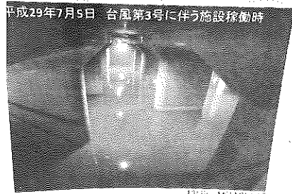
平成29年7月5日 台風第3号に伴う施設稼働時

これを軽減するために、中小河川の洪水を地下放水路に集め、強大なポンプで江戸川に排水する仕組み。2006年に2300億円をかけて誕生した。水が集められる地下空間は、1本500トンもの重さの柱が59本林立している。この様子がパ