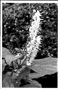
シソ科の多年草。9月～10月に咲き、冬に水柱が