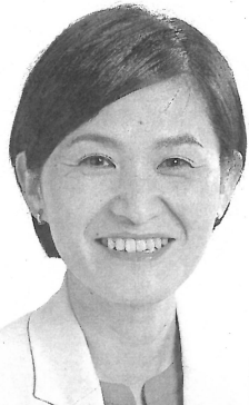
日本共産党前衆議院議員