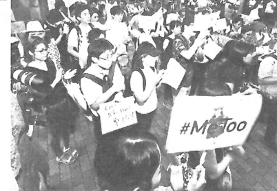
医科大学の前で抗議行動をする市民