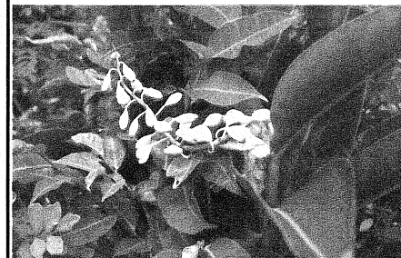
沖縄の苦難の歴史を象徴するといわれる「月桃の花」の写真です。目立たない小さな可憐な花で映画の題名にもなりました。 (7月3日撮影 保坂)

いているので少々の通り雨などで濡れてもすぐに乾く。 歴史の違いについて 教会や美術館、2000年前の遺跡など観光が目いっぱい詰まっています。演奏会後もナポリへ足を延ばし、ソレントの海や海岸、ポンペイの遺跡も訪ねることができた。ベスビオス火山の爆発で町全体が灰の下に埋もれて時間が止まった。2