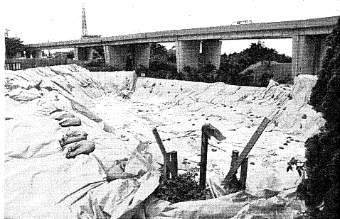
サッカー場枯れ葉剤容器発掘現場