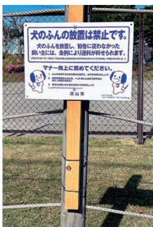
犬のふん放置禁止看板の設置 (美和1号公園) 乾 えり