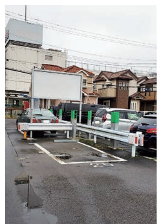
1年半放置されたトラック撤去 (東初石3丁目) 小田桐仙