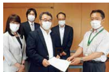
市長に申し入れをおこなう市議団(2月14日から7月2日までに8回おこないました)

市議会では3月に「決議」採択、4月に「緊急提言」提出と会派の垣根を超えて共同し、6月には「条例」を制定させました。どれも、