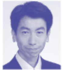
市議会議員 安西 孝之