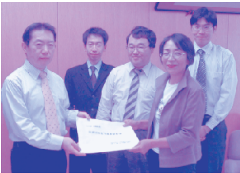
市民要求アンケートに寄せられた願いを市長に届けました。(9月28日)