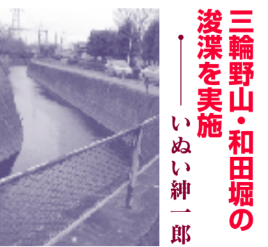
三輪野山・和田堀の 浚渫を実施 いぬい 紳一郎