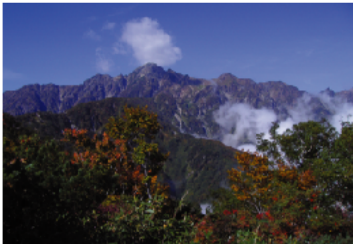
流山市議団ホームページ http://www.geocities.jp/kfbkd645/