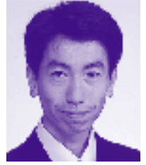
市議会議員 安西 孝之