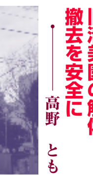
身近な要求実現 旧清美園の解体・ 撤去を安全に 高野 とも