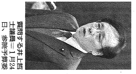
質問する井上西士議員 1月24日、参院予算委員

日本共産党の田村貴昭衆議院議員と井上哲士参院議員は1月24日、衆参予算委員会の閉会中審査で、避難所の食料や生活環境の改善を岸田文雄首相に求めました。 田村氏は「避難所の食事はイノスタント食品が多く、温かくない。温かく炊き出しを求めました。避難所の環境改善、隔離スプレースの確保を含めた被災者の環境改善を求めました。」 「避難所の環境改善、隔離スプレースの確保を含めた被災者の環境改善を求めました。」