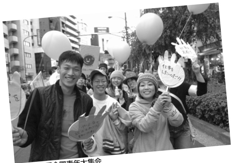
05年第3回全国青年大集会